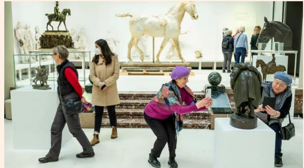
Visitors without protective face masks at the Ny Carlsberg Glyptotek museum in Copenhagen. Denmark recently removed remaining coronavirus restrictions

High levels of rules compliance and vaccine take-up found in Nordic and East Asian nations