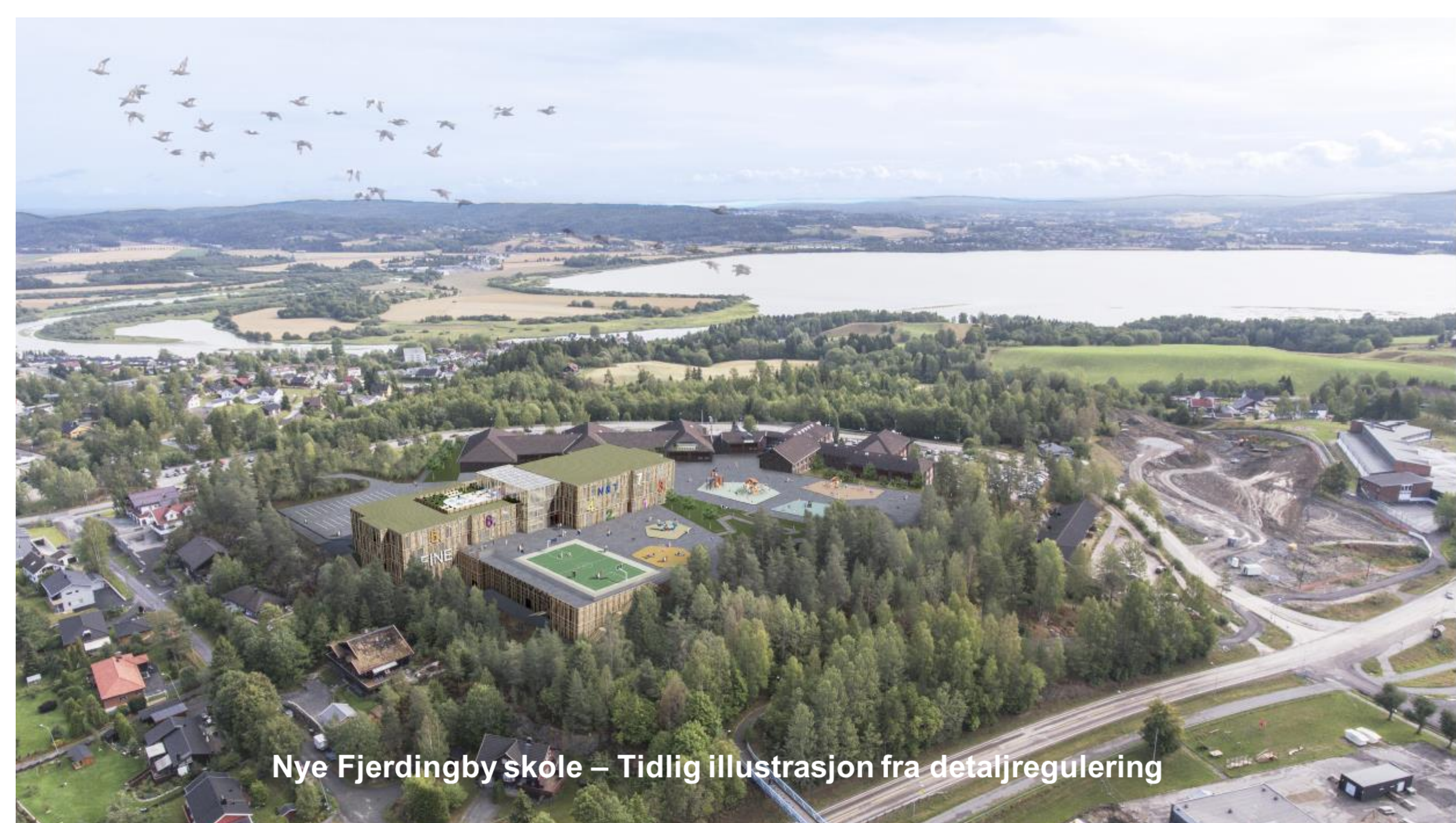
Nye Fjerdingby skole – Tidlig illustrasjon fra detaljregulering