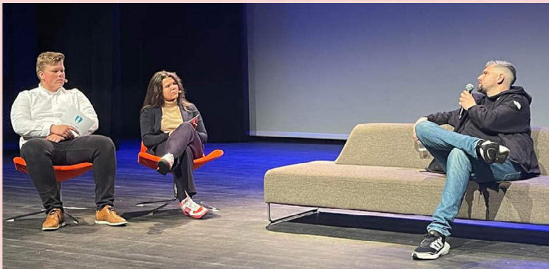
Ungdommer og lokalpolitikere i Lindesnes diskuterte hatprat sammen med Leo Ajkic på Hatpratkonferansen 2022.

Arrangementet var svært vellykket. I tillegg til ungdommer fra skolene i kommunen ble også politikere, eksperter og TV-personlighet, Leo Ajkic, invitert. Deltakerne fikk mulighet til å reflektere over spørsmål de aldri hadde tenkt over tidligere, og de ble både engasjerte og berørte av tematikken. I ettertid har flere av skolene i kommunen bestemt seg for å jobbe videre med tematikken i skolesammenheng.