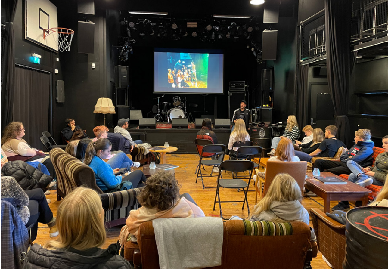
Ungdomsrådene i Nordfjord delte erfaringer i hvordan drive ungdomsråd på samling i Operahuset

elever på 1.–10. trinn. I samarbeid med lag, organisasjoner og andre aktører får barn og unge mulighet til å prøve ut et mangfold av aktiviteter i sommerferien.