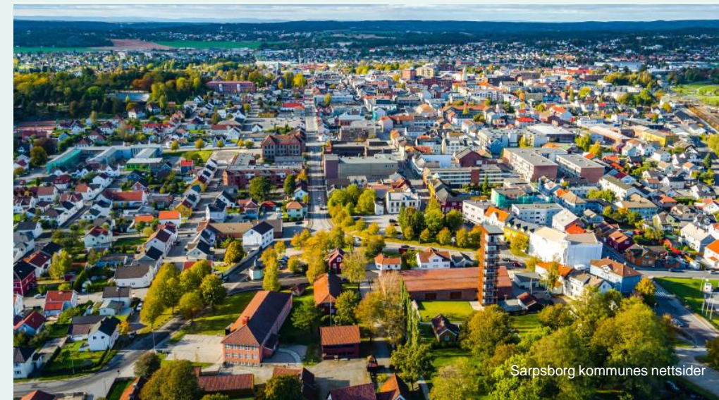
Sarpsborg kommunes nettsider