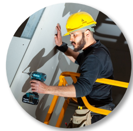
Bygg og anlegg