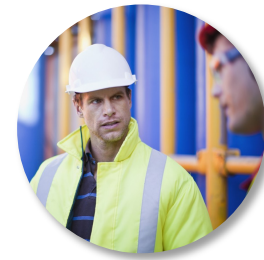
Leverandørindustrien- Olje og gass