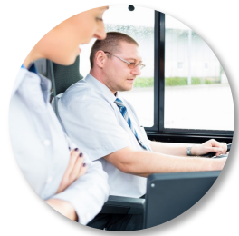
Rutebuss og persontrafikk