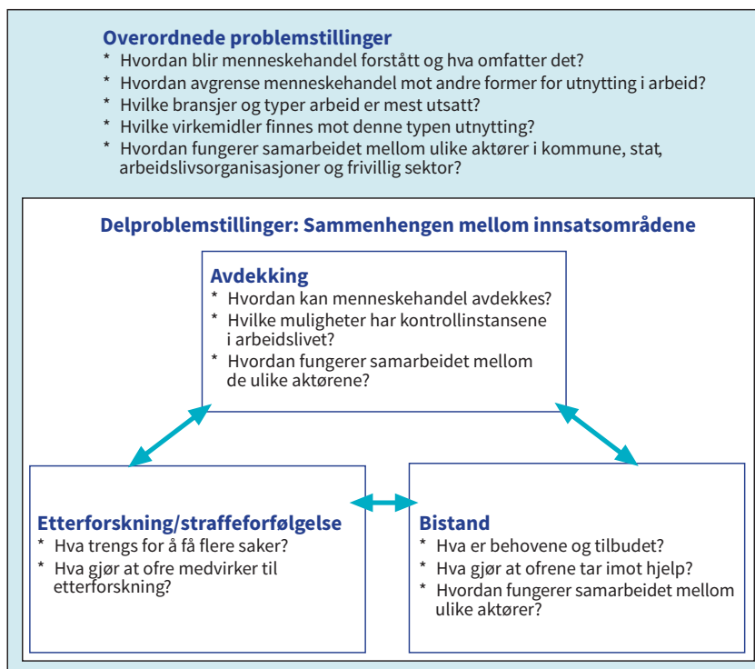
Figur 7.1 Overordnede og delspørsmål i undersøkelse om menneskehandel i arbeidslivet.

Ikke minst er delspørsmålene på de ulike praktiske innsatsområdene nært forbundet med hverandre, og avdekking, bistand og etterforskning/straffefølgelse henger tett sammen (illustrert ved pilene i figur 7.1), slik det også er dokumentert i forskning på området: Muligheten for å identifisere menneskehandel og tilrettelegge for at mulige ofre skal være villige til å motta hjelp og bryte med utnyttingssituasjonen de er i, avhenger i stor grad av at det finnes gode bistands- og beskyttelsestiltak (Ventrella 2007). Samtidig vil gode bistandstiltak være utviklet på bakgrunn av kunnskap om ofrenes behov og situasjon, noe som forutsetter at man faktisk har fått dem i tale (Surtees 2007). Videre er gode bistandstiltak en viktig forutsetning for politiets muligheter til å etterforske saker ved å sette ofre bedre i stand til å medvirke til slik etterforskning (Haynes 2004), samtidig som politiets etterforskning av saker kan legge grunnlaget for at ofre får innvilget en midlertidig oppholdstillatelse/refleksjonsperiode og dermed kan motta bedre bistand (Brunovskis & Skilbrei 2016). Domstolsbehandling skaper rettspraksis og konkretiserer hva som faller innenfor og hva som faller utenfor menneskehandelbegrepet