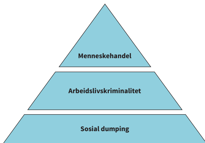
Figur 3.1 Sosial dumping, arbeidslivskriminalitet og menneskehandel.