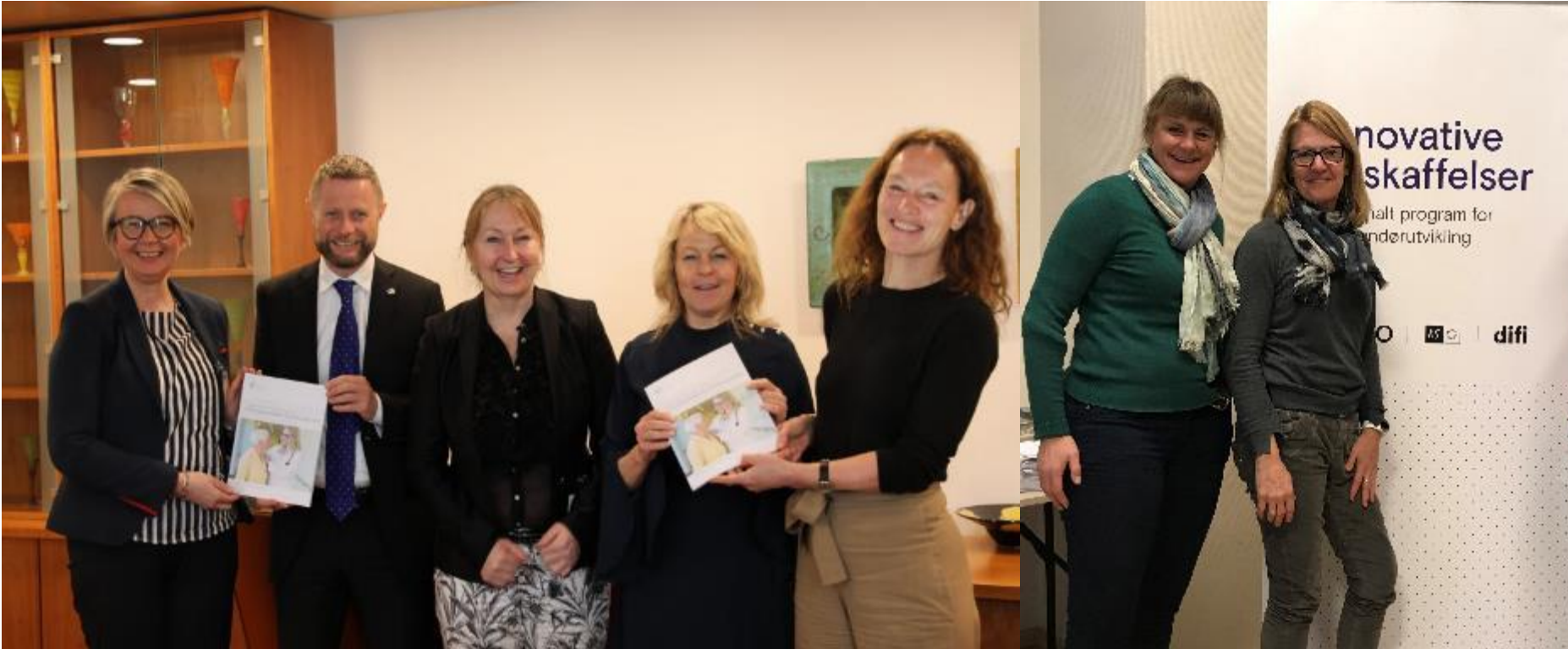
Kommunenes strategiske forskningsorgan - helse