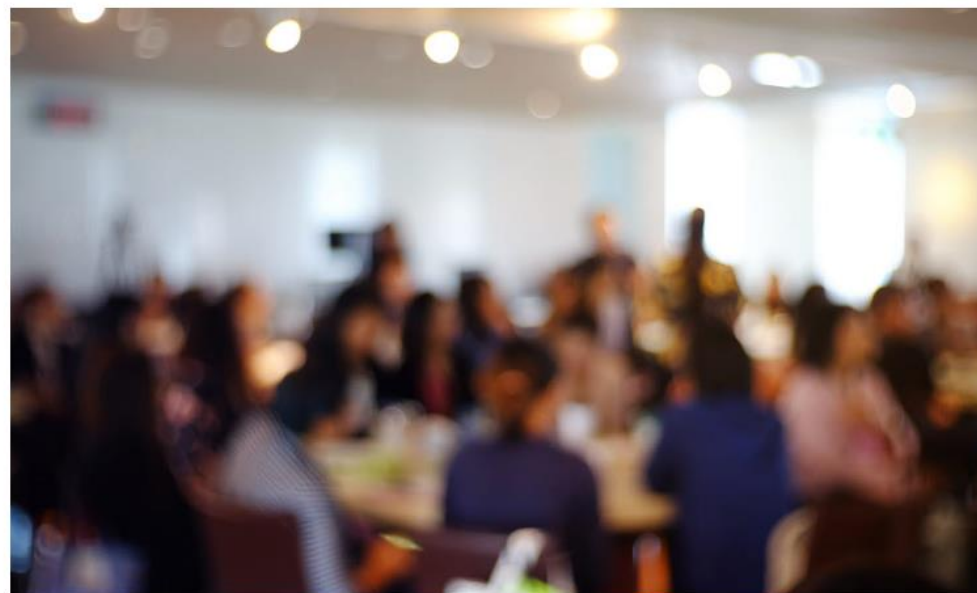
6. desember inviterer KS til seminar om overføringen av skatteoppkreverfunksjonen. Seminaret vil foregå på Radisson Blu Airport Hotell, Gardermoen.