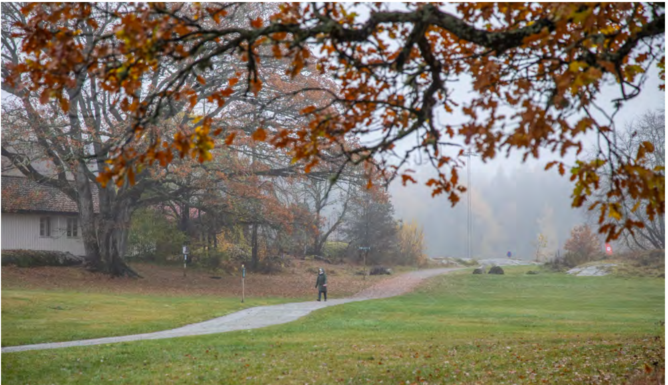
SLAK OG BRED: Riktig stigningsgrad og dekke med 0,7 subbus gir tilgjengelig turvei.