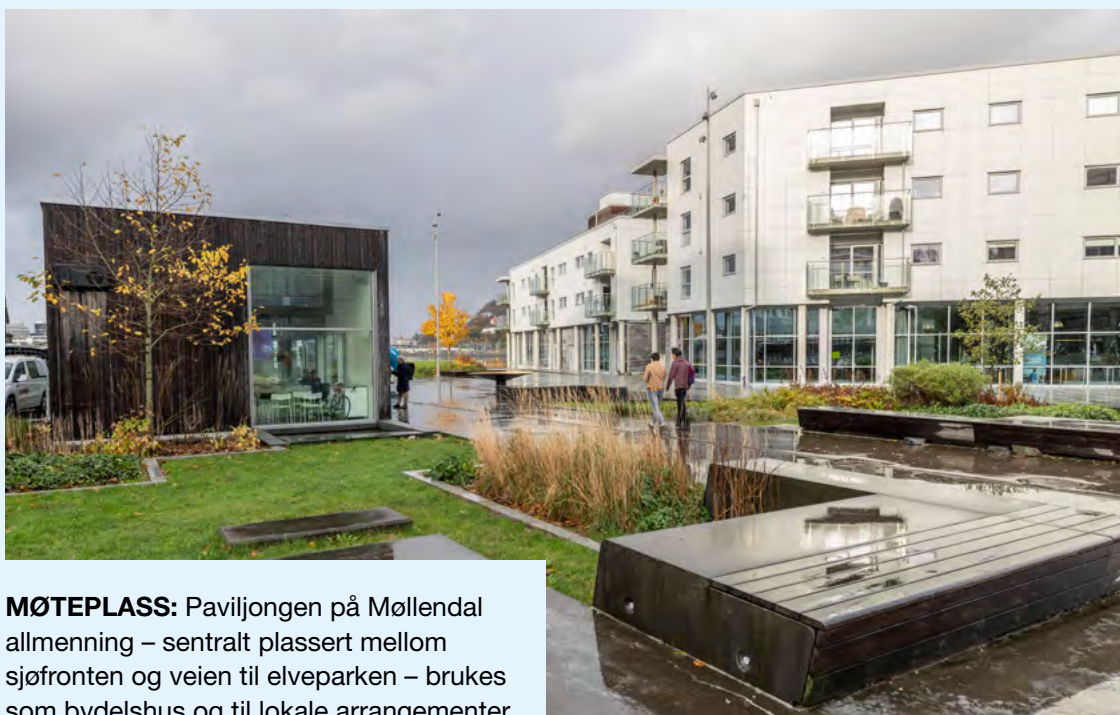
MØTEPLASS: Paviljongen på Møllendal allmenning – sentralt plassert mellom sjøfronten og veien til elveparken – brukes som bydelshus og til lokale arrangementer.

Ny «storstue» for bydelsarrangementer, nytt badeanlegg, urbant torg, aktivitetsplass og grønne områder. Det er lagt vekt på å skape mange ulike soner og bruksmuligheter. Allmenningen er universelt utformet for alle alders- og brukergrupper. Naturlige ledelinjer i dekket, i tillegg til hovedledelinjer med LED-lys fra Kunsthøgskolen ned til kaien. Tilgjengeliggjøre sjøfronten gjennom etablering av ulike nivåer ned mot sjøen. Flytebryggene er tilgjengelig og trillevennlige, men ikke universelt utformet på grunn av flo og fjære.