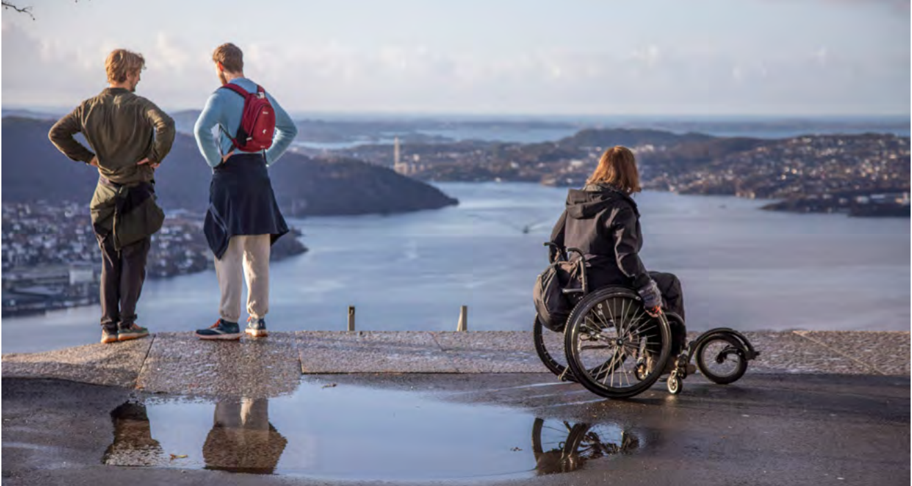
HØYT OVER BYEN: Bergens mest berømte utsiktspunkt, Fløyen, 320 meter over havet. Utsiktsplattformen er tilrettelagt for rullestolbrukere.

men jeg er ikke helt der, sier hun og ler godt.