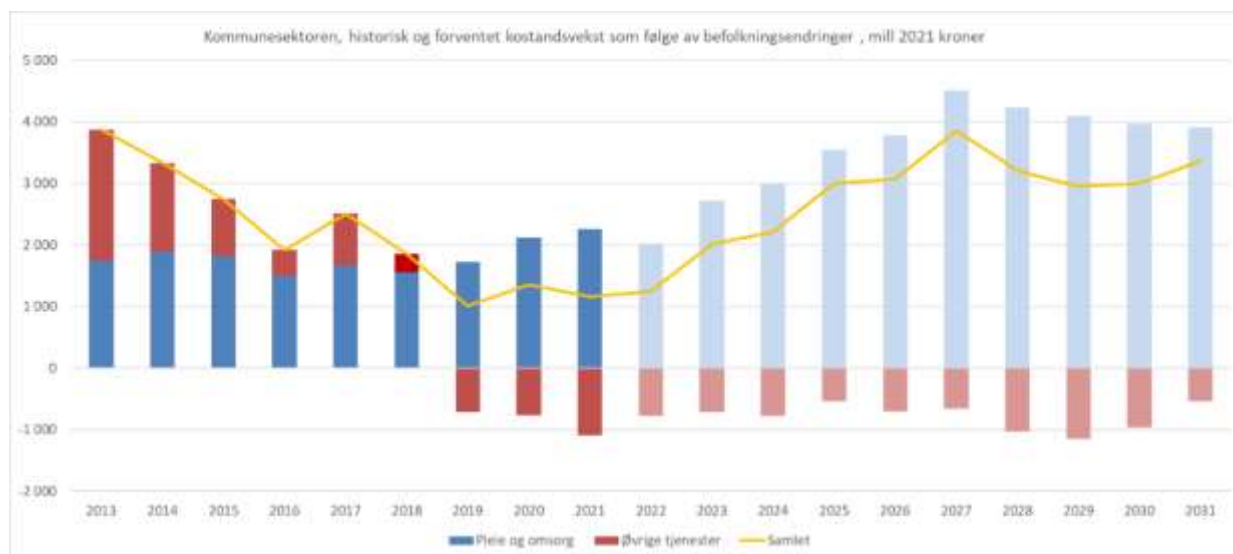
Figur 1 Kommunesektorens merkostnader som følge av demografiske endringer. Mill. 2021- kroner

For fylkeskommunenes økonomi er utviklingen i aldersgruppen 16-18 år særlig viktig. Etter en periode med nedgang i innbyggertallet i denne aldersgruppen, ventes det nå økning. Det er foreløpig anslått at den demografiske utvikling isolert sett vil øke fylkeskommunenes utgifter med 0,7 mrd. kroner i 2023. Av dette anslås at om lag 0,6 mrd. kroner må dekkes innenfor de frie inntektene.