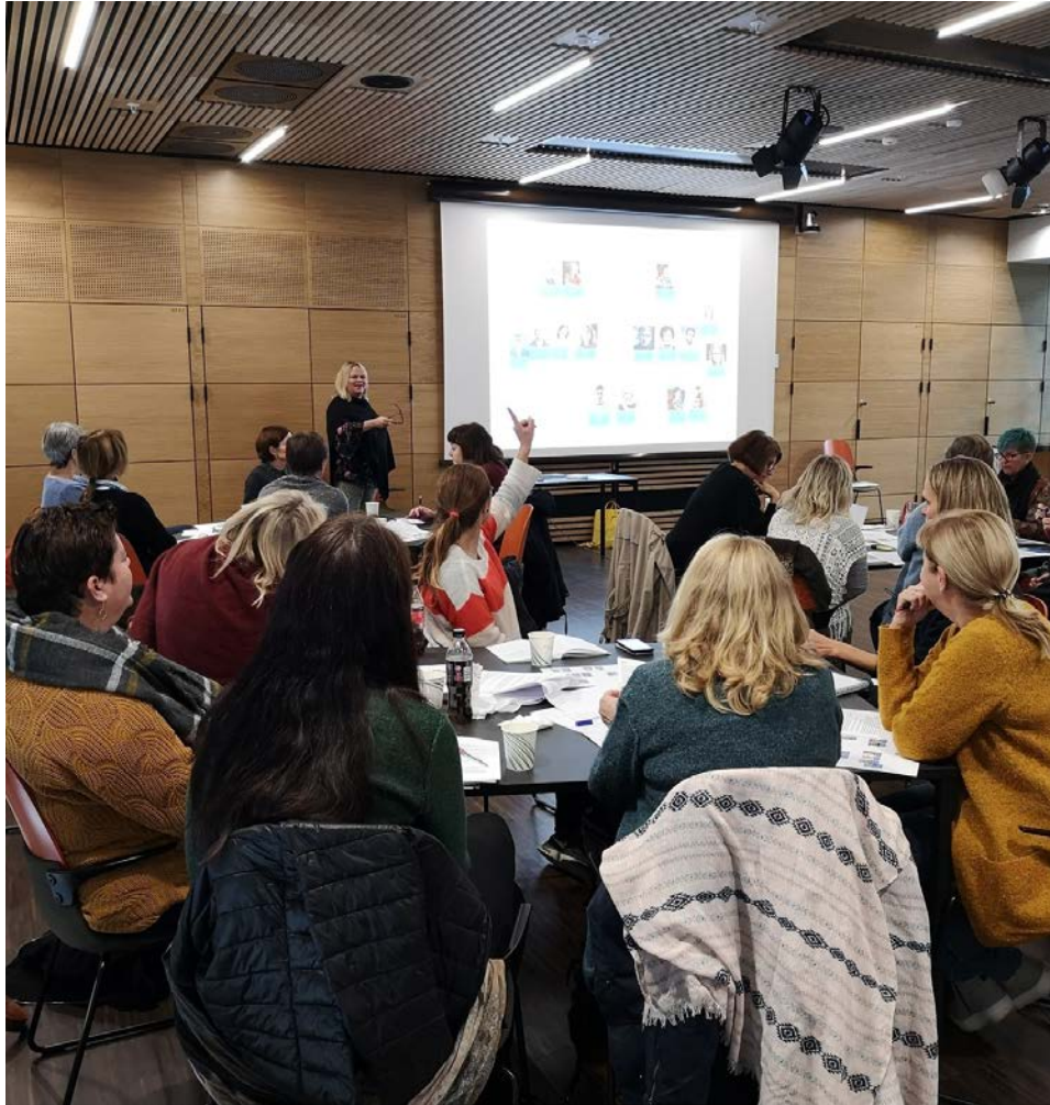
Bilde fra arrangementet.

henge sammen i en familie, hvordan ulike pårørende berøres og etiske dilemma som kan oppstå i dette. Deltakerne fikk innføring i hvordan bruke etisk refleksjonsmodell som et verktøy når man står foran etiske dilemma. Det er gitt tilbakemeldinger til arrangørene om at fagdagen var tankevekkende og svært nyttig.