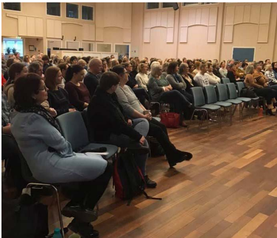
Bilde fra den regionale fagdagen i etikk i Vestfold.

Satsingen har i 2019 arrangert en regional fagdag i samarbeid med Senter for medisinsk etikk i Rogaland med særlig fokus på erfarne etikkveiledere og ansatte med et meransvar for etikkarbeidet i kommunen. SME/KS startet opp dette tilbudet i 2018 på bakgrunn av tilbakemeldinger om behov for flere regionale møteplasser på den nasjonale samlingen for etikkveiledere som SME arrangerer årlig. Tilbakemeldingene på denne felles fagdagen var gode, så vi ønsket å gi flere regioner samme tilbud i 2019. Vi hadde planlagt en tilsvarende dag i Tromsø høsten 2019, men den ble utsatt. Våren 2020 arrangerer vi en felles fagdag for denne målgruppen i Trøndelag.