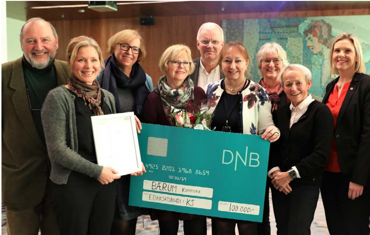
Årets vinner av Etikkprisen 2019, Bærum kommune.