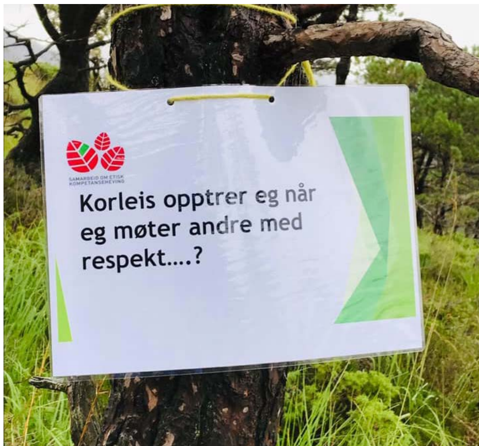
Bilde fra åpningsturen i Etikkveka.