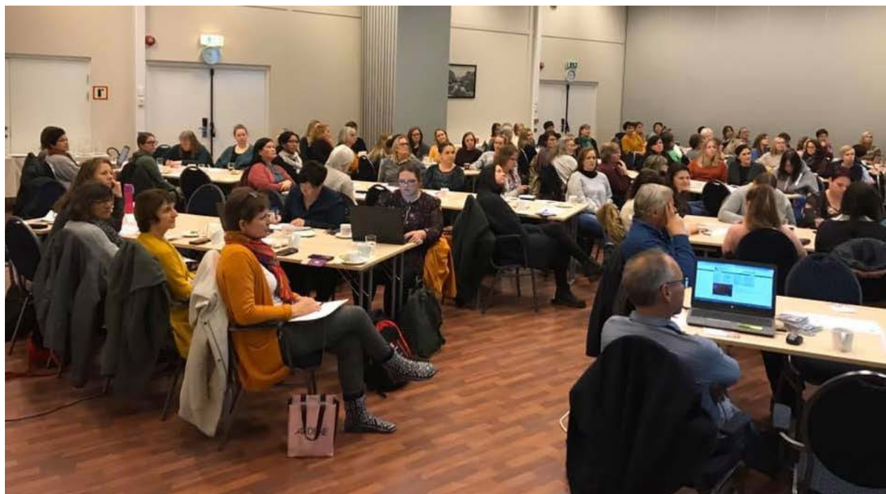
Foto fra samlingen.

Systematisk etisk refleksjon er systematisk utforsking av ein situasjon. Refleksjon hjelper oss til å sjå saka frå fleire side, få nye perspektiv. Identifisere verdier, ta begrunna og informerte avgjørsler. Derfor er det naturleg og sjå reforma og systematisk etisk refleksjon som ein god metode for endring, og implementering av gode tiltak.