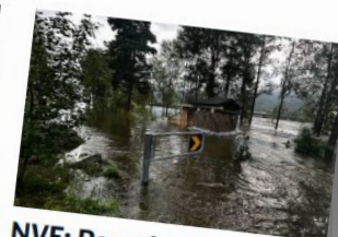
NVE: Regn kan forlenge flaumtoppen