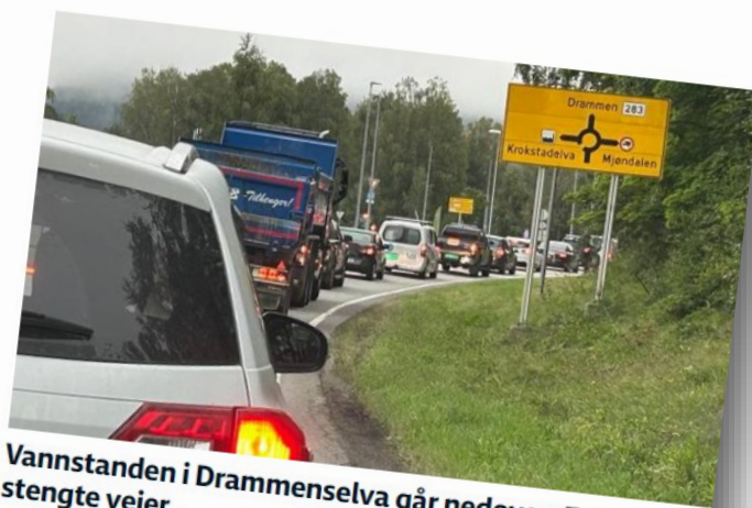
Vannstanden i Drammenselva går nedover: Fortsatt stengte veier