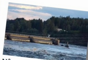
Nå er strømkablene ved kraftverket sprengt