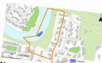
Har oppdaga erosjonshol i Hønefoss: evakuerte bebuarar får ikkje flytte heim