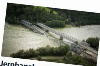
Jernbanebrua har rast sammen: Ble anbefalt kontrollert i 2019