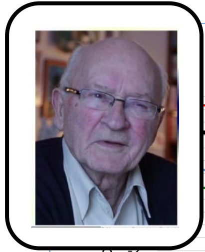
Opplevd nytte fra "Hva er viktig for deg?"-samtalene