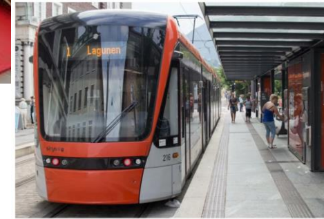
Nasjonale forventninger til regional og kommunal planlegging 2019–2023