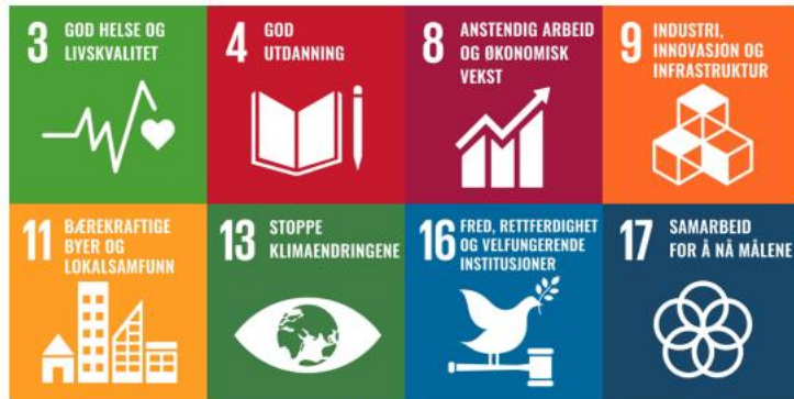
Figur 7: Utvalgte fokusmål i Narvik kommune