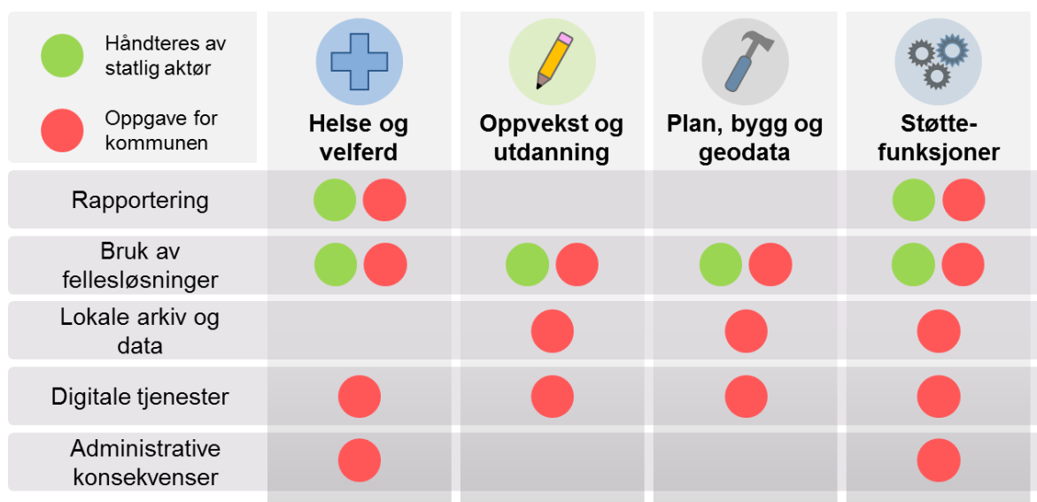
Figur 1. Oversikt over konsekvensene av å endre kommunenummer.

Figuren under synliggjør at endring i kommunenummer fører til konsekvenser for alle sektorene og støttefunksjonene i kommunen. Der kommunen må utføre oppgaver knyttet til endring av kommunenummer, er det satt inn en rød prikk. En grønn prikk betyr at endring av kommunenummer håndteres av en statlig aktør uten behov for involvering fra kommuner.