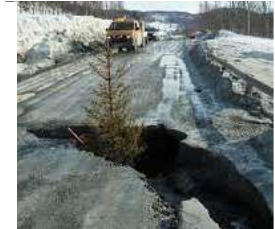
Fylkesvei i Troms.

Gjennskaffelsesverdien for fylkesveier er estimert til 700 milliarder kroner. Dette er halvparten av verdien i State of the Nation 2015. Et godt estimat, basert på erfaring, for utgjør oppgjørte gjennskaffelsesverdi 15 milliarder per million kilometer.