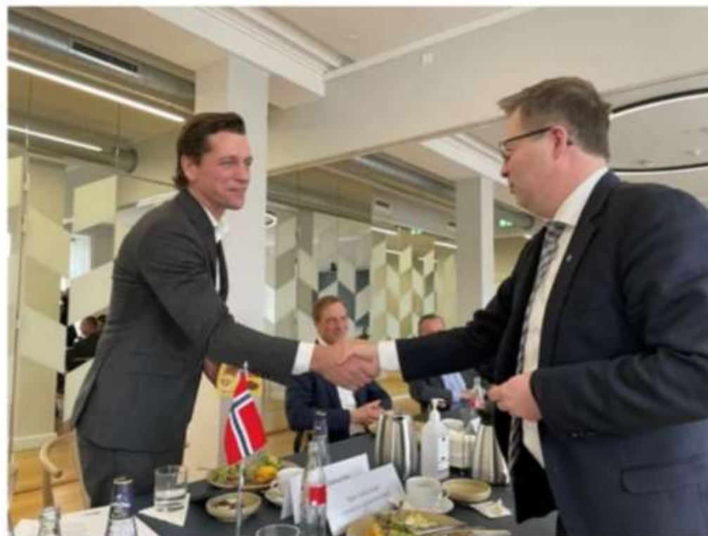
STATSRÅDSMØTE: Kommunal- og distriktsminister Bjørn Arild Gram med sin danske kollega, innenriksminister Kaare Dybvad Bek.

Danmark slipper kommunene fri. Nå har kommunal- og distriktsminister Bjørn Arild Gram vært på besøk for å la seg inspirere.