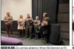
HJELP OG ERBE. De sentrale aktørene i filmen fikk båndstør av KS...