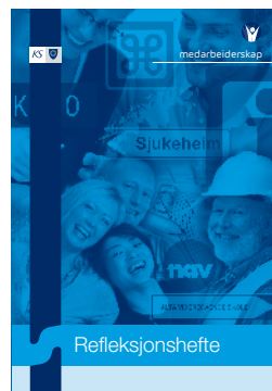
På informasjonsmøtet får hver deltaker utdelt et refleksjonshefte

Del III av heftet kalles «handlingsplan». Her skal deltakerne oppsummere og lage en konkret plan for det de ønsker å jobbe med framover.