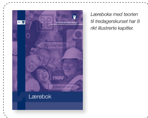
Læreboka med teorien til tredagerskurset har 8 rikt illustrerte kapitler.

Det er også viktig at tredagerskurset tilpasses den enkelte kommune. På dag to er det lagt opp til at en repr. for øverste ledelse kommer og forteller hvordan kommunen er organisert og hvordan kommunen styres i dag. Kommunen står