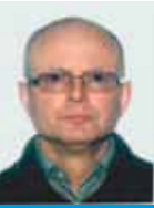
Av Per Brunovskis HTV Karmøy kommune

I utgangspunktet var samarbeidet mellom legene og kommunen forholdsvis inaktivt. Det kom et vendepunkt da vi ble invitert til samarbeidsmøtet hvor KS og Rogaland legeförening møttes i 2010. Å høre hvordan andre kommuner hadde det, inspirerte i hvert fall meg til å ta tak i samarbeidet med Karmøy kommune.