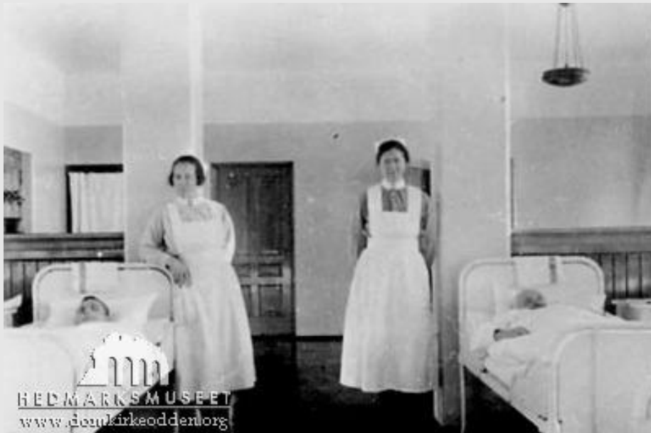
Sanderud sykehus, Hamar